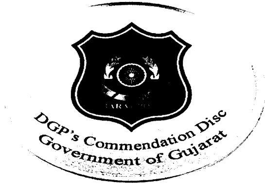
First time Disc